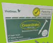
Pinnen 4 inch