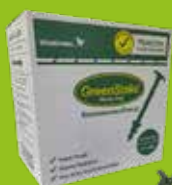
Pinnen 6 inch